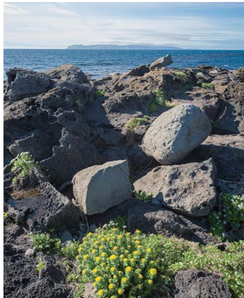
利尻島から見た礼文島