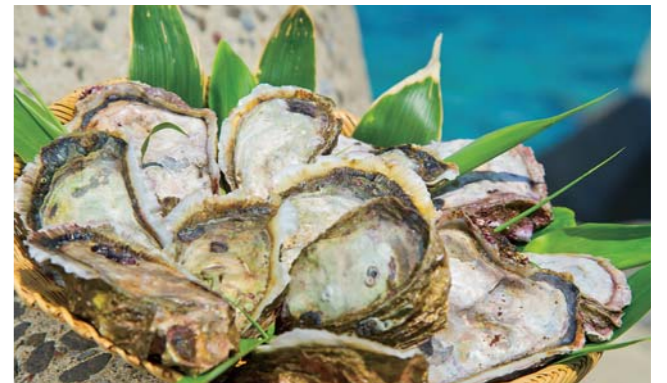
北海道で唯一養殖に取り組んでいる奥尻島のイワガキ。 ウニやアワビにつづく、奥尻のあらたな高級食材として期待したい