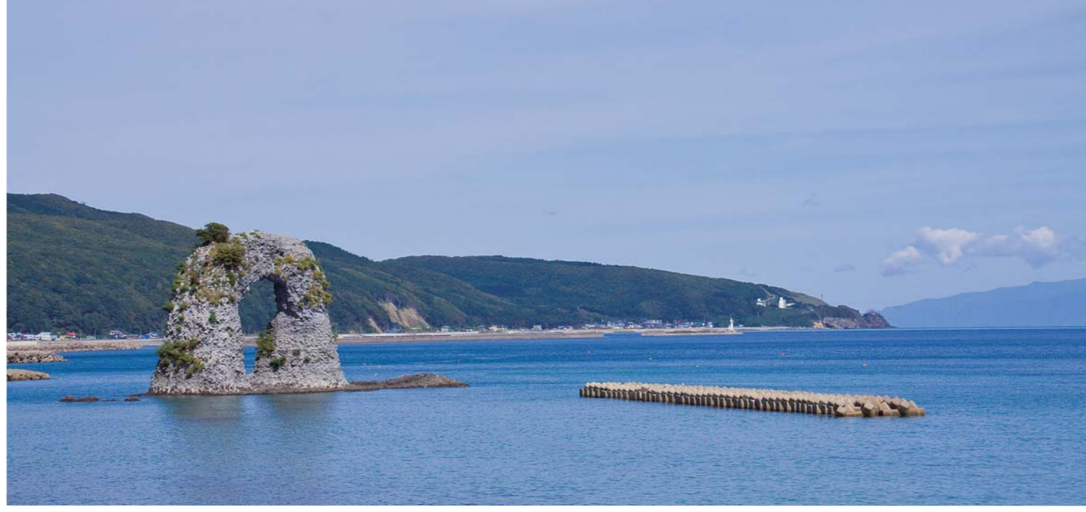
奥尻島のシンボル「なべつる岩」。夜にライトアップされる姿も美しい

今回の特集では、五つの島と対岸のまち取材。 詳細のMAPや交通については本文を参照のこと 利尻島・礼文島—稚内市→P30-31 天売島・焼尻島—羽幌町→P48-49 奥尻島—江差町・せたな町→P59