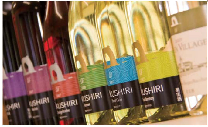
「奥尻ワイン」のラベルにも「なべつる岩」がデザインされている