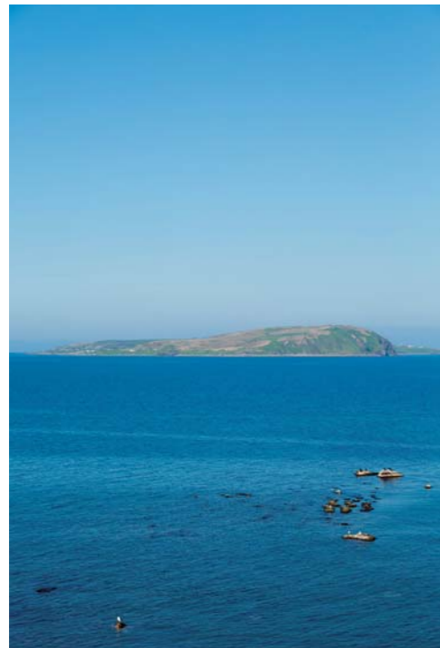
天売島から見た焼尻島