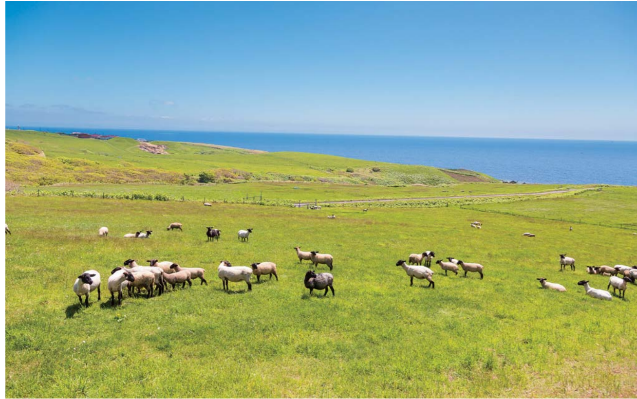
萌州ファームの「焼尻めん羊牧場」