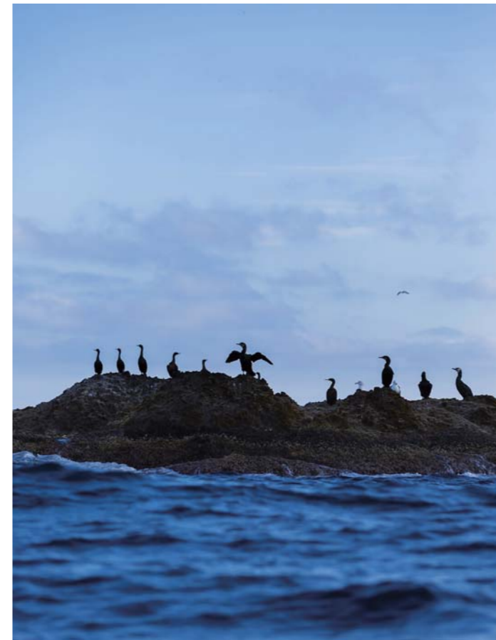
焼尻島から見た天売島